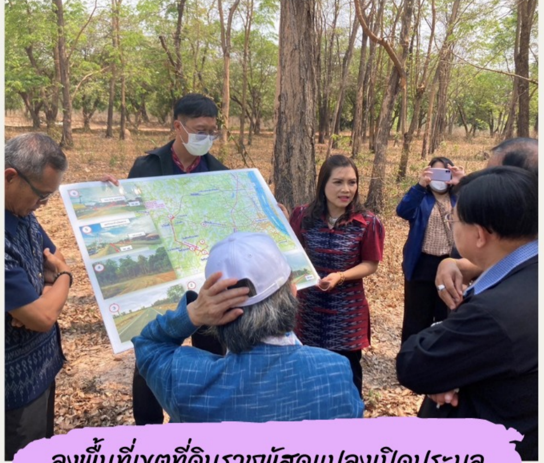
ลงพื้นที่เขตที่ดินราชพัสดุแปลงเปิดประมูล ในเขตพัฒนาเศรษฐกิจพิเศษมุกดาหาร